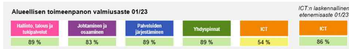
Kuva 3: Päijät-Hämeen alueellisen toimeenpanon valmiusaste 01/23